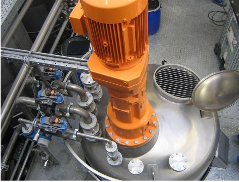
Resim 3.1: Cila karıştırma ve çalkalama işlemi

Burada dikkat edilmesi gereken, atıkların esas olarak prosese eşlik eden yan proseslerden üretildiğidir. Olası redüksiyon potansiyeline sahip olan atık ve kısmen atık suyla ilgili yan prosesler şunlardır: