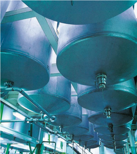
Resim 5.2: Cila üretimi – Konteyner boru sistemi

Hatalı kullanımlar ve bunlardan kaynaklanan hatalı dolumlar, dolum prosesinin büyük ölçüde otomatikleştirilmesi sonucu hemen hemen imkânsız hale getirilebilir. Tabii ki otomatik dolum ve boşaltım sistemlerinin uygulanması ölçüm, kullanım, ayarlama teknolojileri, ilave borular, yeni ara ve tampon kapları ile ölçüm ve ayarlama aletlerinin beklenmesi için yeni masraflarla birlikte düşünülmez.