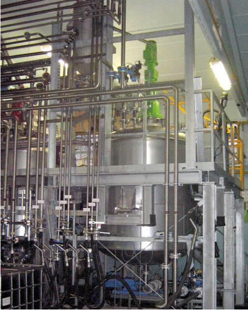
Resim 5.1: Cila üretim tesisi