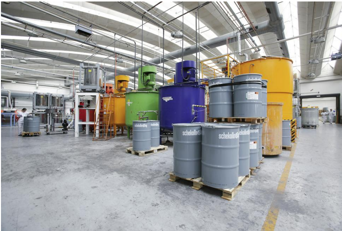
Resim 3.2: Cila dolun

Bunların dışında hatalı ürünlerden veya müşteri iadelerinden de atıklar oluşmaktadır.